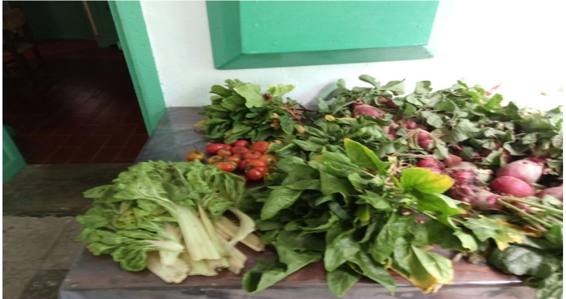
Primera cosecha en el Muulasterio Tegoyo

trasplantamos 120 ejemplares en un campo cedido por un hermano. Después fuimos al Muulasterio y nos preparamos un desayuno elaborado con los productos de la huerta y el corral de aves. A continuación tuvimos una animada conversación sobre la salud y la sanación en la que decidimos pedir un TAP para el lunes siguiente, 25 de abril, día en que se conmemoraría el primer aniversario de la energetización de la actual sede del Muulasterio, en Tiagua.